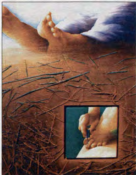
Den store pedicuredag, 71 x 61 cm.