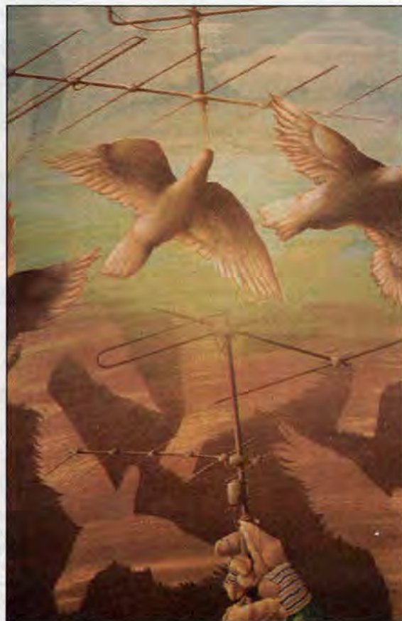
Antennefragment, 122 x 80 cm.