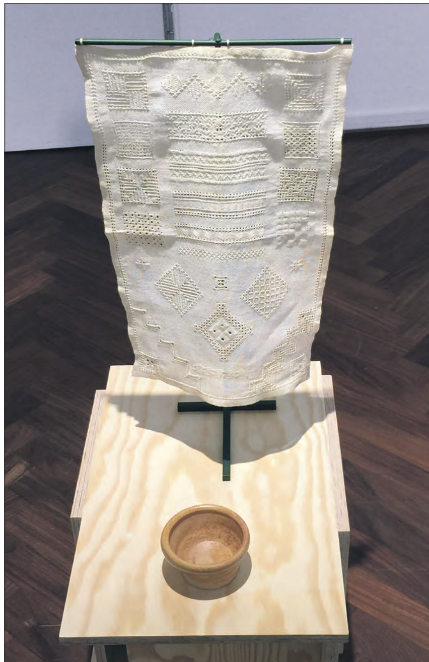
Værk af Jørgen Carlo Larsen

Denne indre spænding i Bodil Nielsens billeder bliver aldrig destruktiv. Farverne og formerne, enkeltdele,