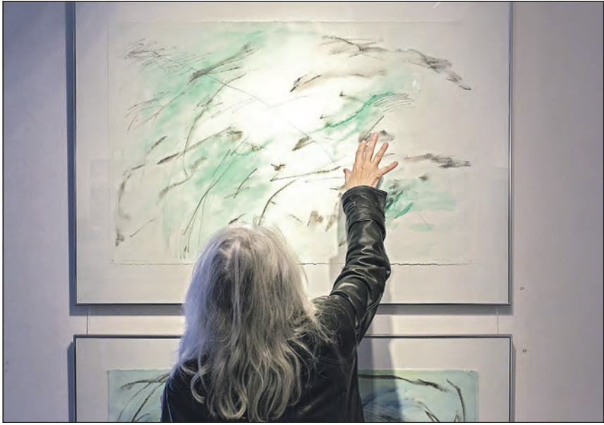
Tegnagtige formationer opleves som store arkaiske landskabspanoramaer på Birgitte Ramskovs akvarel med tusch og grafit.