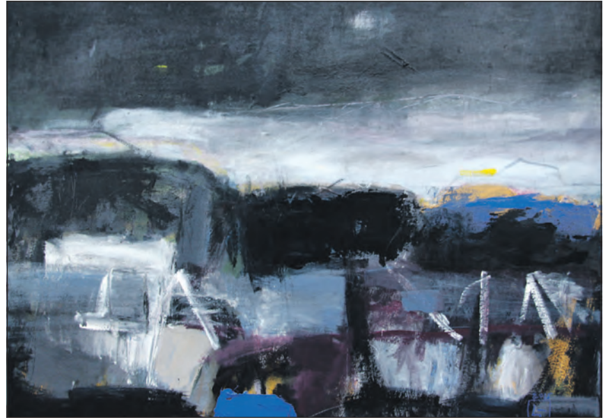
Lise Tuxen viser nordiske landskaber med kraft og rytme, store vidder og bjergformationer i skitseagtige udtryk.